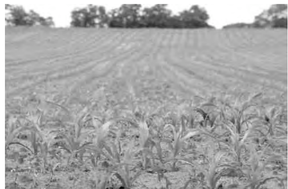
Ein Maisfeld im Frühsommer

2006 ist die Märka von der Sauter-Gruppe aufgekauft worden. Diese engagiert sich vor allem in der Produktion von so genannten Biokraftstoffen. Welche Auswirkungen das auf die Kooperation mit Monsanto hat, wird sich noch zeigen müssen. 7