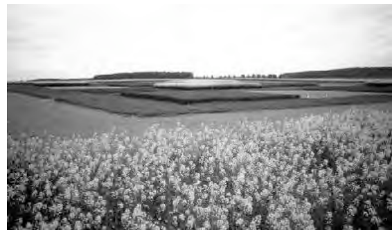
Eine gentechnische Anlage in Brandenburg