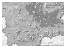
Gentechnikfreie Region Spreewald