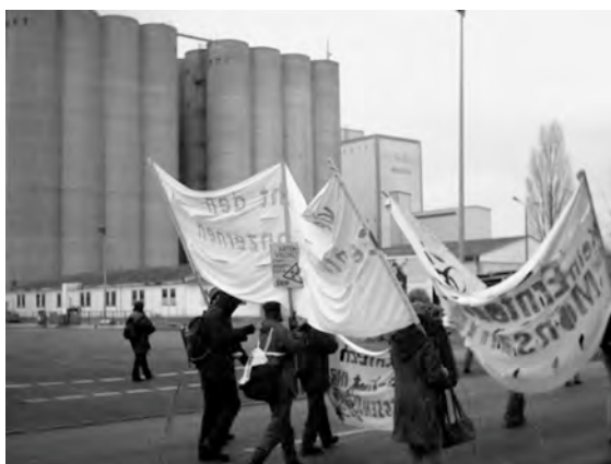
Demonstration vor der Märka in Eberswalde Frühjahr 2006

Monsanto seinerseits setzt aber die Bauern, die gv-Mais anbauten erheblich unter Druck. Wie die Arbeitsgemeinschaft bäuerlicher Landwirtschaft (AbL) der Presse mitteilte, sieht der Anbauvertrag, den Monsanto mit den Gen-Bauern abschließt, vor, dass Informationen, die er seinem Händler gibt, an Monsanto weitergereicht werden. Mehr noch: Der Bauer sichert zu, dass er "einen Monat nach der Aussaat den Namen und die Adresse derjenigen Bewirtschafter mitteilt, die in einem Feldrandabstand von weniger als 100 Meter“ konventionellen Mais aussäen. Damit erhoffen sich Monsanto und Märka eine Abwälzung des Schadens auf den Gen-Bauern, falls er einen zu geringen Feldrandabstand einnimmt.