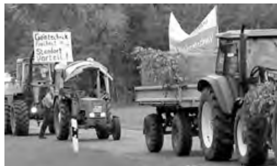
Auf der Trecker-Demo 2005 zur Aktionswoche in Eberswalde

So entsteht neben der Futtermittelproduktion für den Eigenbedarf mit der Bioenergie ein zweites Standbein der Gentechnik-Industrie in Brandenburg, ohne dass der Verbraucher davon unmittelbar tangiert ist. Monsanto und Märka können so weiter unbehelligt von den Protesten der Lebensmittelkonsumenten die schrittweise aber stetige Durchmischung mit gv-Mais in Brandenburg vorantreiben. Und dafür erhalten sie noch den staatlichen Segen eines Landwirtschaftsministers Woidke und profitieren von den staatlichen Millionen für nachwachsende (Gen-)Rohstoffe. What a wonderful brave new world!!