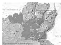
Die gentechnikfreie Region Uckermark Barnim

Die Arbeitsgemeinschaft bäuerliche Landwirtschaft (AbL) und der Bund für Umwelt und Naturschutz (BUND) sind gemeinsam Träger des Projektes „Gentechnikfreie Regionen in Deutschland“. Auf ihrer Internetseite ist eine regelmäßig überarbeitete Liste aller GfR, sowie viele weitere Informationen zu gentechnikfreien Regionen, erhältlich: www.gentechnikfreie-regionen.de .