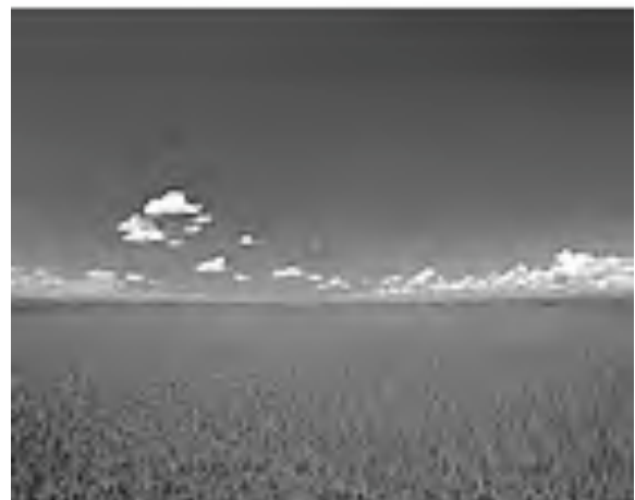
Monokultur in der intensiven Landwirtschaft