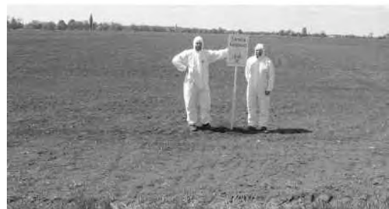
Feldkennzeichnung zur Aktionswoche im Mai 2005. Noch ist nichts vom Mais zu sehen.

Ein weiterer Aktionsbereich besteht in der klassischen Lobbyarbeit: Pressekonferenzen, Treffen mit Politikern und gemeinsame Pressemitteilungen. So wurde 2005 unter anderem auf die falschen Angaben im Standortregister hingewiesen. Ebenso beteiligten wir uns an dem „Tafeln für Bio“ im Herbst 2005 und der Bantam-Mais Aktion im Jahr 2006.